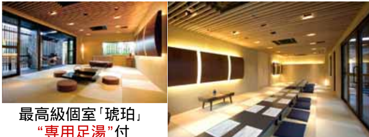
最高級個室「琥珀」 “専用足湯”付