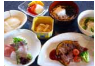
コース料理の内容は お問合せください。